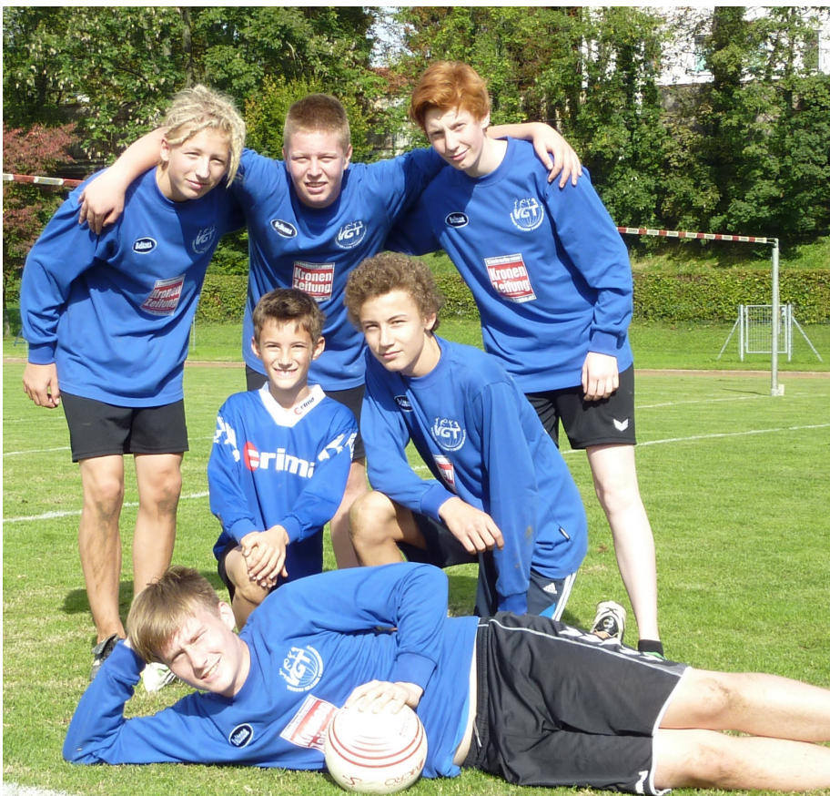
Unsere erfolgreiche Jugendmannschaft bei der Heimrunde am 22.9. auf der Hasenheide